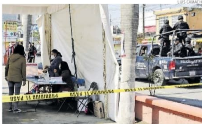
Elementos de seguridad vigilaron la consulta.

El total de votos computados en el Estado de México ascendía a un millón 551 mil 490, lo cual representaba el 12.6% de