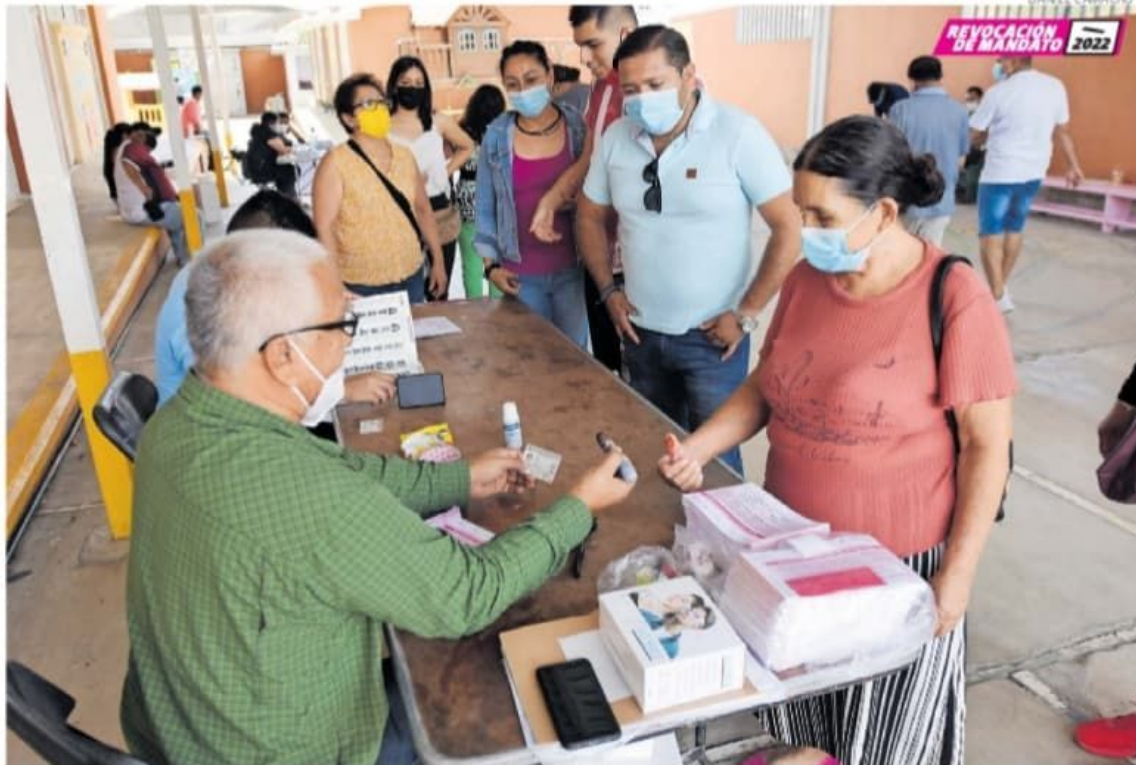
En Tejuipilco la jornada fue sin incidentes.

“Anduve preguntando y ni los policías sabían dónde estaban las casillas”.